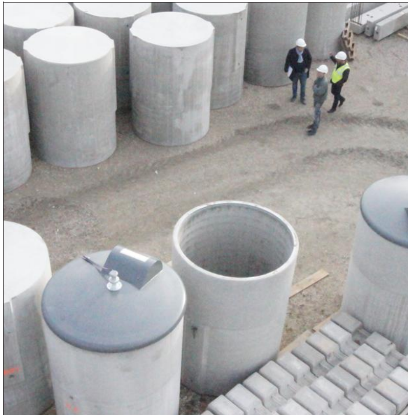
■ Une cuve a une profondeur de 2,60 mètres environ.

Dernièrement, CBPréfa a récupéré un nouveau marché : les cuves souterraines qui permettent de déposer nos déchets. « Il y a une nouvelle logique environnementale de la part des politiques. Ils se sont rendu compte que commander un produit dans un pays où la main-d'œuvre était moins chère, était peu écologique. Il faut acheminer la commande jusqu'ici et utiliser des moyens polluants. C'est comme cela que Biloba, à Lyon (Rhône), a récupéré le marché des cuves et s'est tourné vers nous », commente Jean-Marc Vivier. Car une cuve souterraine est faite en deux parties : la cuve en béton d'une profondeur de 2,60 mètres environ pour un total de 5 m 3 , et à l'intérieur, une autre cuve, métallique-fabriquée par Biloba – dans laquelle on jette les déchets. Lors du passage du ca-