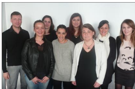
■ En formation pour intégrer Sells en CDI.

Société spécialisée dans le développement des ventes en milieu technique, Sells a vu le jour en 2014 au centre-ville de Bourg. Début 2016, l'entreprise organise avec Pôle emploi et Cap emploi, une préparation opérationnelle à l'emploi. 14 personnes vont la suivre avec, à la clé, une embauche pour six d'entre elles. Et pour Sells, un chiffre d'affaires qui double tous les ans, de nouveaux clients chaque mois et une masse salariale triplée en un an.